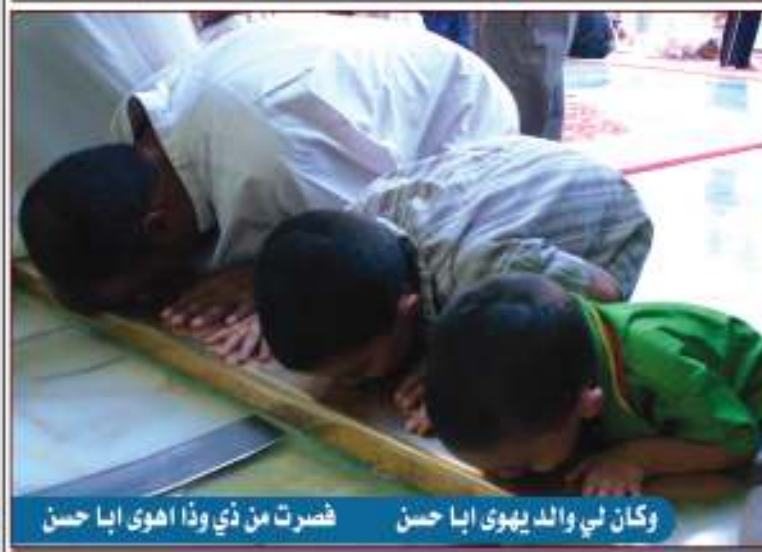
وكان لي والد يهوى أبا حسن فصرت من ذي وذا أهوى أبا حسن