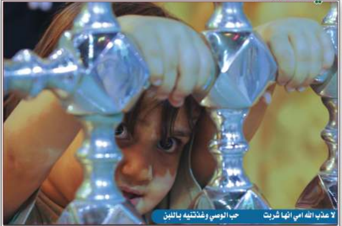
لا عذاب الله أمي أنها شربت حب الوصي وغذتني باللبن

فبكى معاوية وقال: رحم الله أبا الحسن، قد كان والله كذلك فكيف حزنك عليه يا ضرار، فقال: حزن من ذبح ولدها في حجرها، فهي لا يرهق دمعها ولا يخفى فجعها).